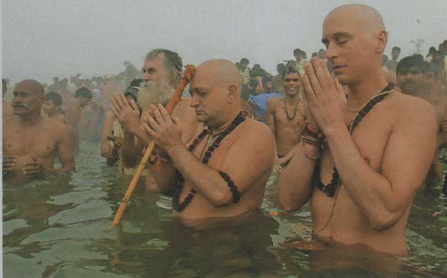
Šahi Snan ali kraljeva kopel je osrednji obred, na katerem se ob ugodnem času in ugodnih dneh milijoni romarjev potopijo v svete reke.