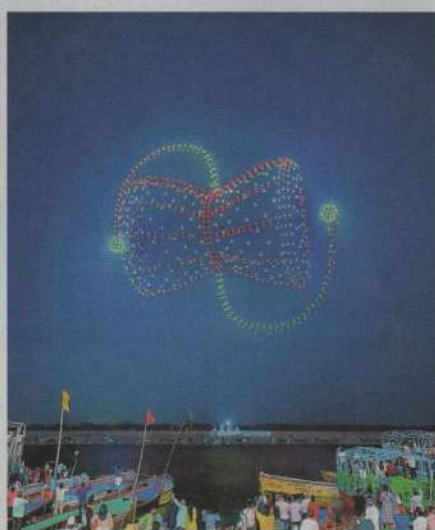
Šov brezpilotnih letal.

Za še dodatno varnost je razporejenih več kot 50 tisoč pripadnikov, vključno s paravojaškimi silami. Okre-