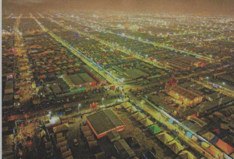
Mahakumbh Nagar se je spremenil v začasno mesto s tisoči šotorov in začasnih prenočišč.

strokovnjaki na ključnih lokacijah. V ta namen bodo uporabili več kot 2.700 nadzornih kamer z umetno inteligenco in brezpilotnih letalnikov za nadzor iz zraka. Uporabili bodo tudi tehnologijo prepoznavanja obraza na vstopnih točkah za večjo varnost. Za zagotavljanje požarne varnosti bodo poskrbela štiri gasilska vozila z dviznim vodnim topom, primerna za požare, ki v višino segajo do 35 metrov in v širino do 30 metrov. Gasilska vozila so opremljena z napredno tehnologijo za preprečevanje požarov in večjo varnost, vključno z video in termovizijskimi sistemi. Prvič se bo na območju Sangam neprekinjen nadzor izvajal s podvodnimi brezpilotnimi letalniki, ki se lahko potopijo do 100 metrov globoko. Za kibernetsko varnost bo skupina 56 kibernetskih bojnikov