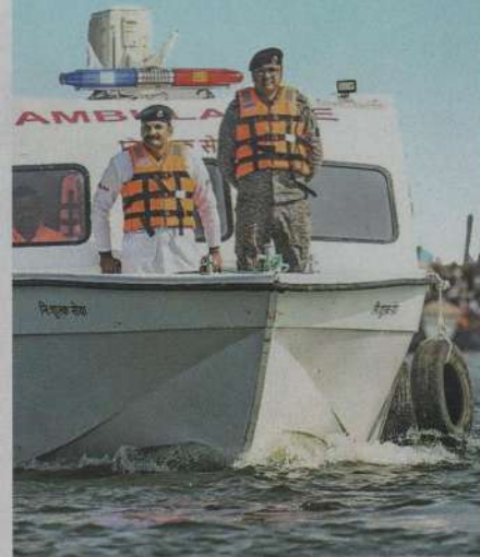
V času festivala bo okrepljena varnost ob rekah Ganges in Jamuna, zlasti na območju Sangam.

milijonov vernikov z vsega sveta, bodo prikazane starodavna kulturna dediščina in duhovne tradicije Indije. Dogodek je bil leta 2017 uvrščen na Unescov Reprezentativni seznam nesovne kulturne dediščine človeštva.